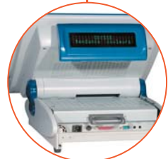
optionale 2. Festplatte