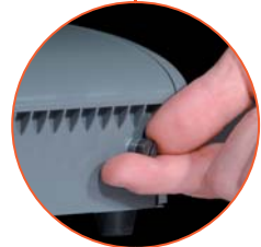
werkzeugloser Zugang zur Technik