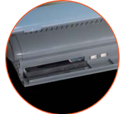
2 USB Retail DVD und CD Leser