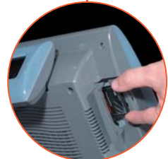
Compact Flashcard Leser